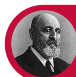
LEONARDO TORRES QUEVEDO

"El más prodigioso inventor de nuestro tiempo"